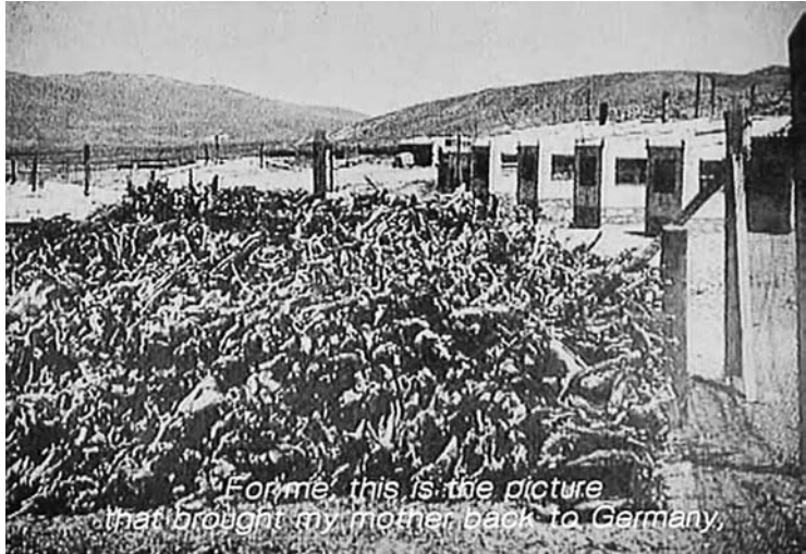
10 Die abgeholzten Stämme der Polylepsis.

«Auf diesem Foto, das sind abgeholzte Stämme der Polylepsis. Es ist der einzige Baum, der über viertausend Metern Höhe in den Anden wachsen kann. Er gehört zur Familie der Rosen. Seine Stämme sind vom Klima in sich verdreht. Meine Mutter hatte ihn in den Hochanden erforscht und wollte darüber in Bonn eine Arbeit schreiben. Für mich ist es das Foto, das meine Mutter zurück nach Deutschland gebracht hat.»